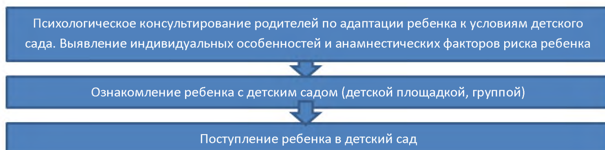
Схема работы с детьми в период адаптации

Цель: создание условий для успешной адаптации ребенка к детскому саду и формирование потребности в общении со взрослыми и детьми.